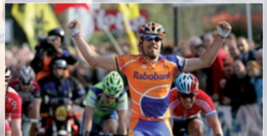
Aankomst te Alsemberg