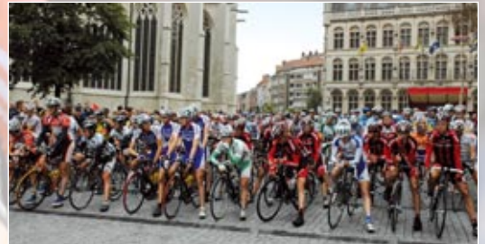
Start te Leuven